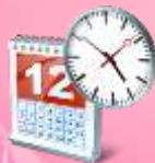
График работы :